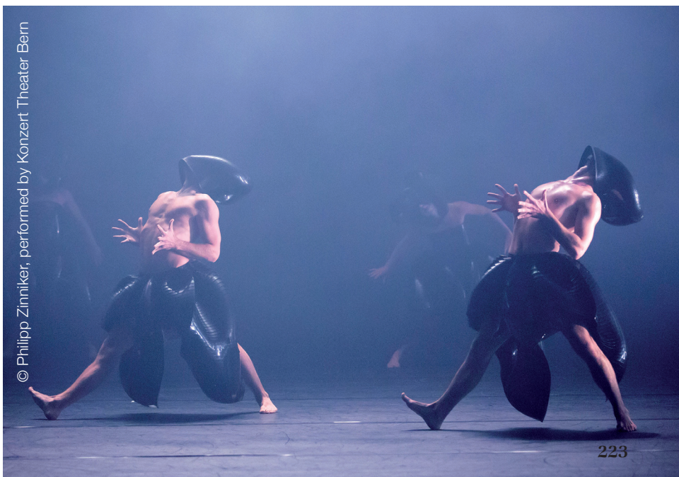
© Philipp Zinniker, performed by Konzert Theater Bern