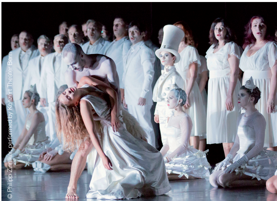
performed by Konzert Theater Bern